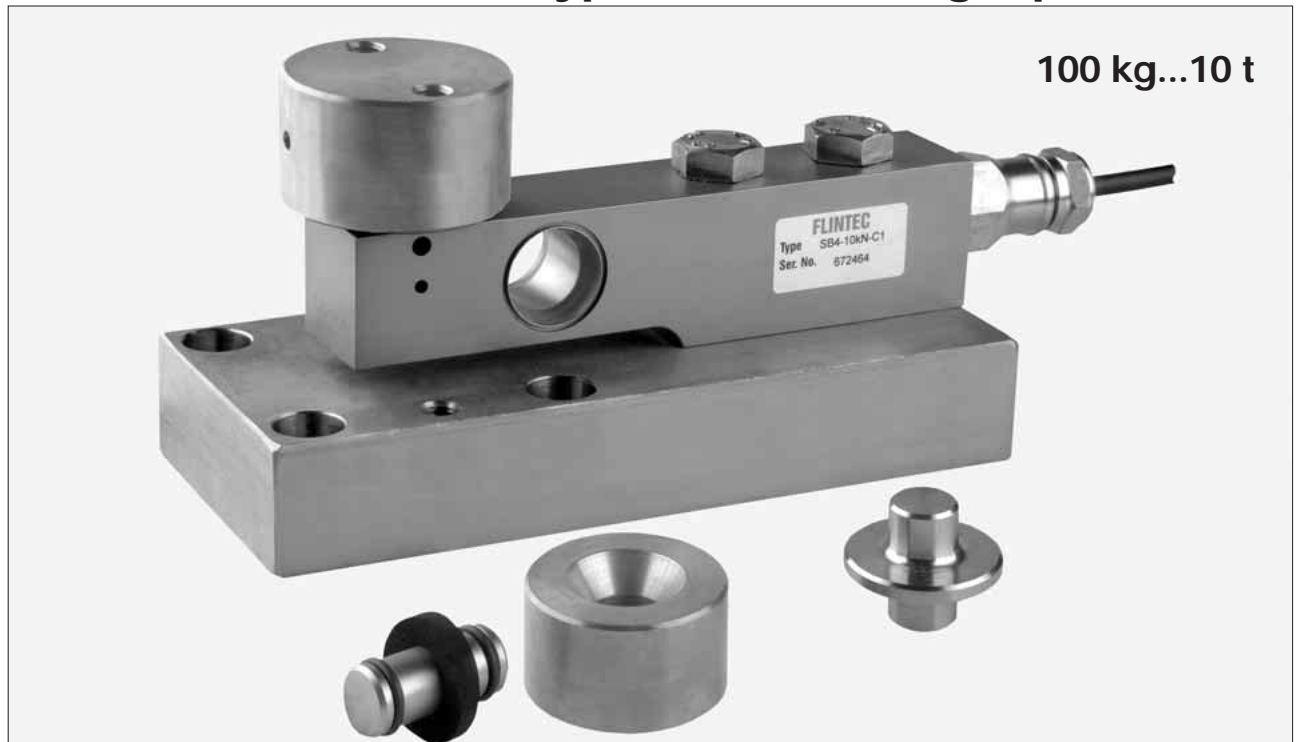
Montage pendulaire 52-08 et capteur SB4 ensemble avec plaque de base 52-00

Les supports de capteurs FLINTEC sont conçus pour éviter les influences des mauvaises charges sur le capteur. Le type 52-08 est un montage glissant auto-centrant qui offre un montage idéal au niveau des forces et de l'encombrement. Destiné aux capteurs SB4, SB5, SB14 et SLB. Une entretoise pour faciliter le montage est disponible. Matériau: acier zingué, alternativement acier inox.